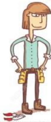
Image printed on non-recycling paper. For personal use only - reproduction is prohibited