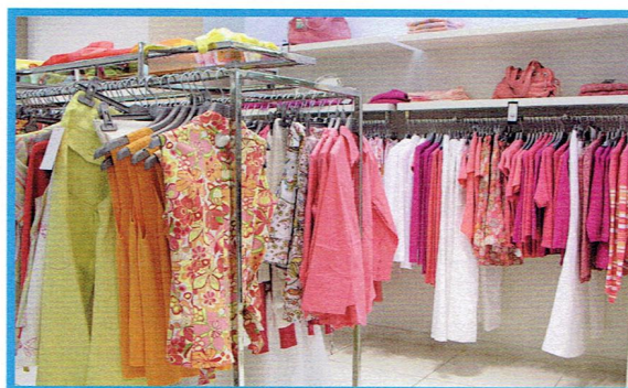
SKLEP Z UBRANIAMI