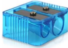
temperówka 2 zł

A teraz wyobraź sobie, że będziesz szła do sklepu trzy razy. Za każdym razem będziesz miała 10 złotych. Co sobie kupisz? Musisz wydać całe 10 złotych.