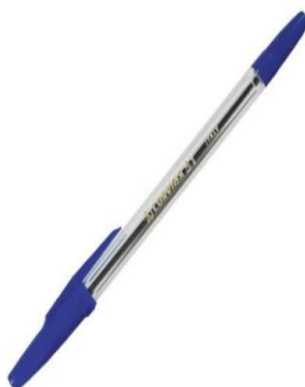
długopis 3 zł