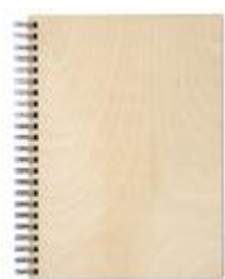
notes 2 zł