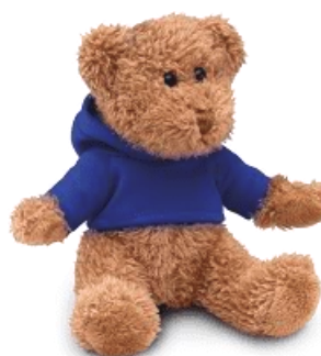
maskotka 7 zł