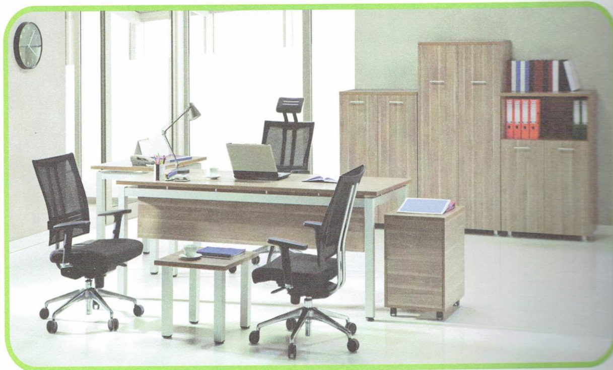
WŁAŚCIWIE DOBRANE MEBLE